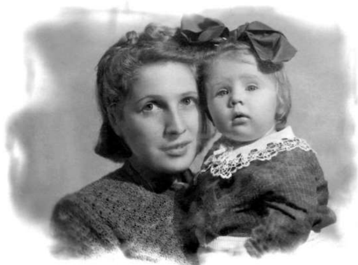
Мама с дочкой (05.12.1945)