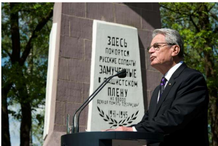
Йоахим Гаук – Федеральный президент ФРГ в 2012–2017 годах