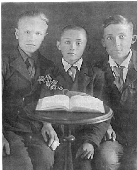
Уже в апреле начали работать школы; нас восстановили в пионерской организации