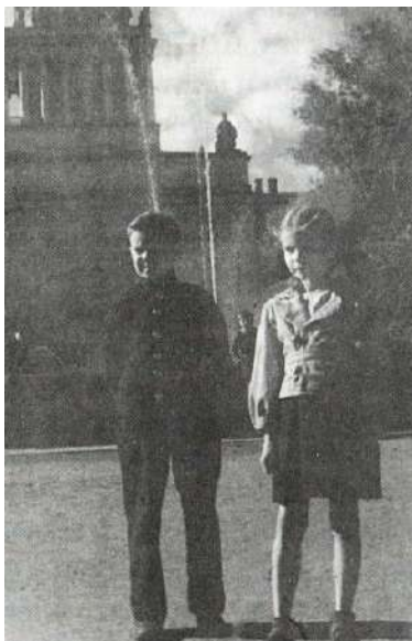
Ленинград. Август 1944 г.