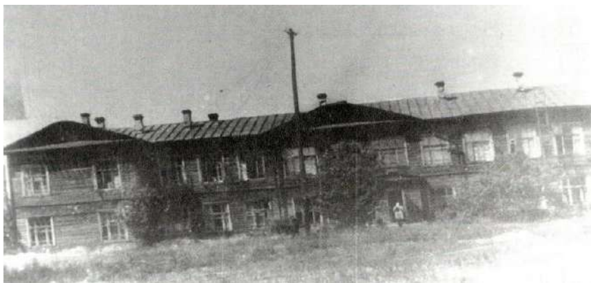
1-й корпус эвакуогоспиталя № 5820, г. Шарья

Летом, вообще, у нас с сестрой находилось много занятий. В нашем распоряжении была огромная территория больничного сада, забор, с которого видно далеко вокруг, дровяной сарай, где мы, отгородив себе фанерой угол, устроили штаб. Главное украшение штаба – гипсовый герб СССР с отбитым краем, его нам удалось по дешевке купить в книжном магазине в центре Шарья, магазин но-