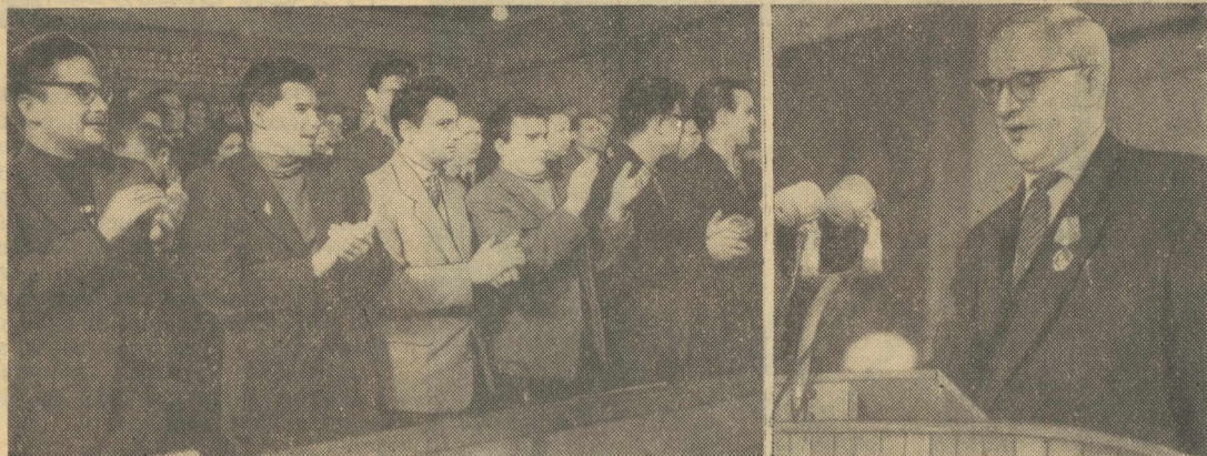
Пролетарии всех стран, соединяйтесь!