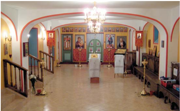
2010 год, март. Общий вид храма.