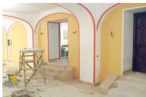
2009 год — цокольный этаж главного корпуса.

На отделке помещения храма безвозмездно потрудились студенты, аспиранты и сотрудники МИФИ.