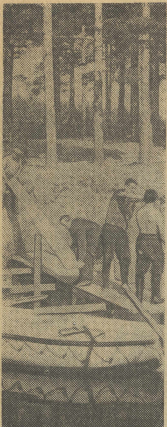
На строительстве пирса для лагерного флота.