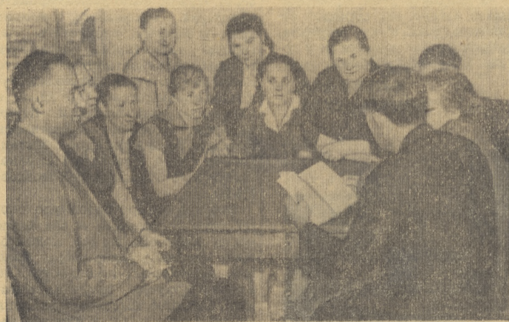
Радостно воспринял коллектив нашего института проекты Программы и Устава КПСС.

Мешали нашей работе не (Окончание на 2-й стр.).