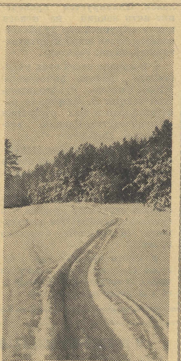
Зимняя дорога...