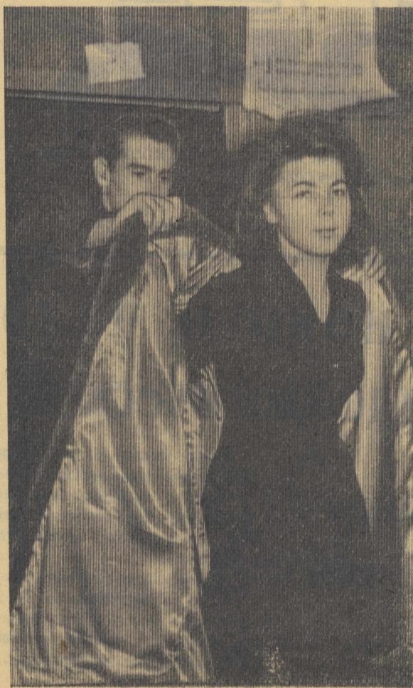
Девушкам нравится такое самообслуживание...