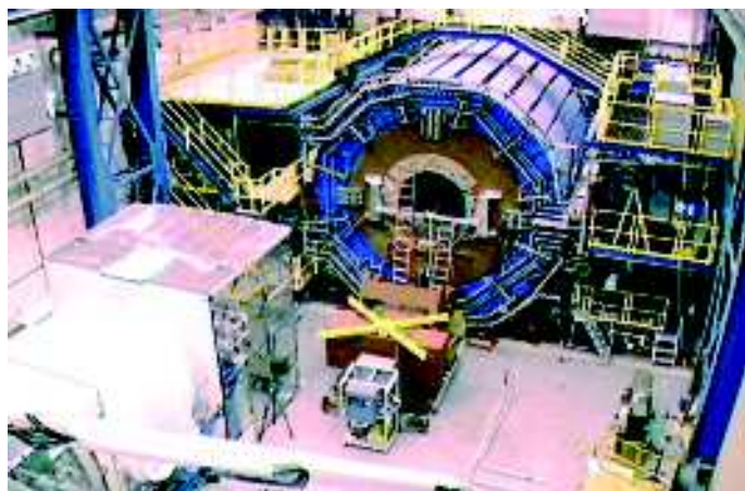
Общий вид установки STAR в экспериментальном зале на коллайдере RHIC.