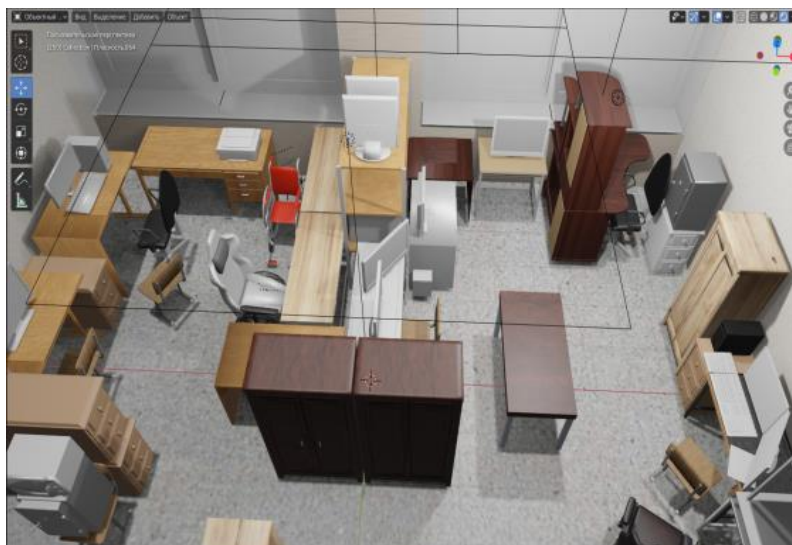
Рисунок 3 – Модель лаборатории «Робототехника» (В-208).

Каждый этап разработки и тестирования подкреплялся документированием результатов, что позволяло систематически настраивать параметры и улучшать качество виртуальной среды, а также повышать точность алгоритмов навигации ИСУ. Результаты экспериментов подтвердили эффективность предложенной методики.