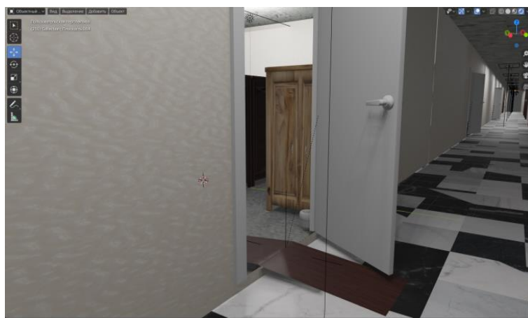
Рисунок 2 – Модель коридора второго этажа НИЯУ МИФИ.

После создания и детализации всех компонентов модели был создан набор текстур для корпуса, колес и дополнительных деталей, используя различные методы, такие как текстурный рисунок, шум и карты окружения, чтобы улучшить визуальное качество модели. Затем модель была экспортирована в формат URDF с использованием специального плагина для последующего использования в симуляторе Gazebo.