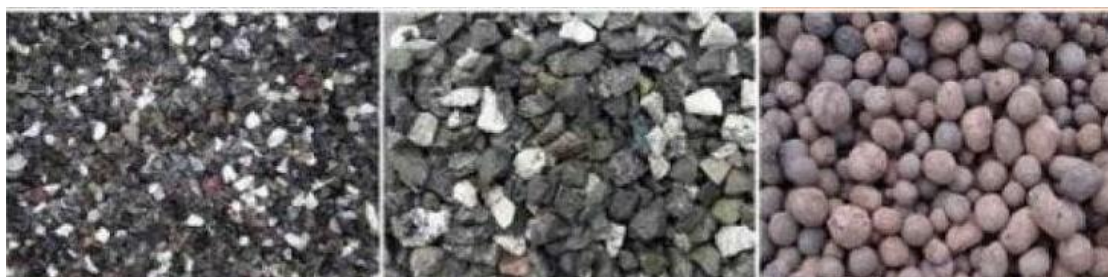
Рис. 3. Виды крупного заполнителя

При смешивании мелкого заполнителя с крупным прочность бетона повышается вместе с объемной массой. Исследованиями установлено, чем прочнее зерна заполнителя, имеющие более округлую и ровную поверхность, тем меньше объемная масса бетона.