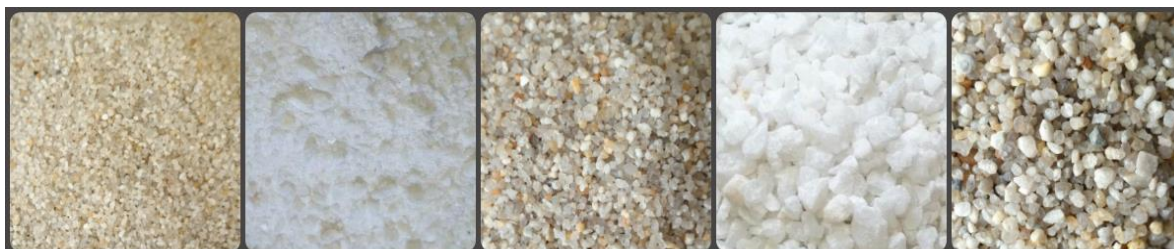
Рис. 2. Виды мелкого заполнителя

Крупнопористые бетоны, которые состоят из пористого заполнителя, могут обладать меньшей объемной массой и меньшей прочностью [4].