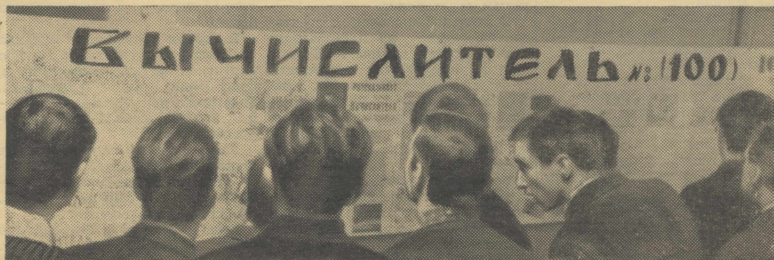
Вышел сотый номер «Вычислителя»...