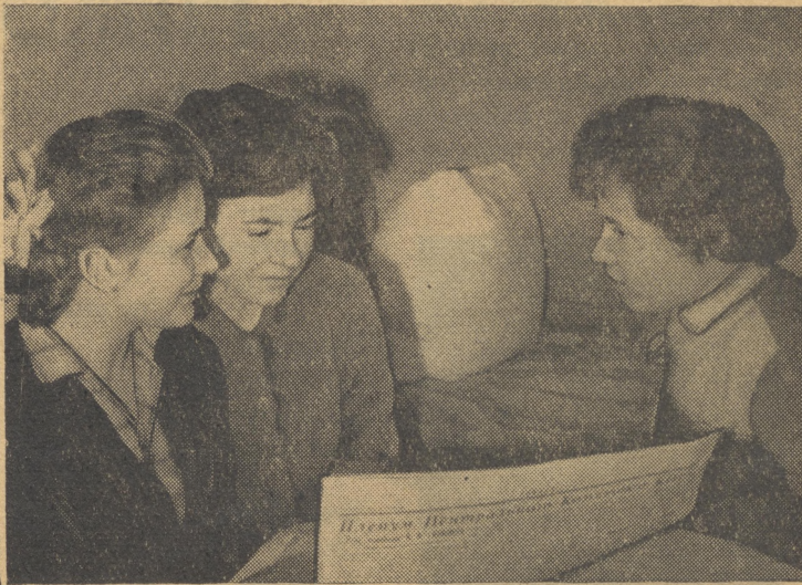
На снимке: в одной из комнат общежития на Зацепе. Девушки с факультета «В» знакомятся с решением ноябрьского Пленума ЦК КПСС.

Все советские люди с интересом знакомятся с материалами Пленума. Коллектив института приступает к систематическому изучению этих исторических решений: студенты — на занятиях по общественным дисциплинам, преподаватели и сотрудники — в сети политического просвещения.