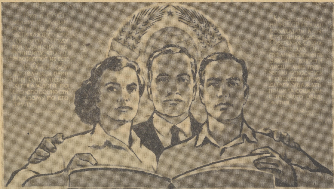
КОНСТИТУЦИЯ СССР — ОСНОВНОЙ ЗАКОН СОВЕТСКОГО ОБЩЕСТВА