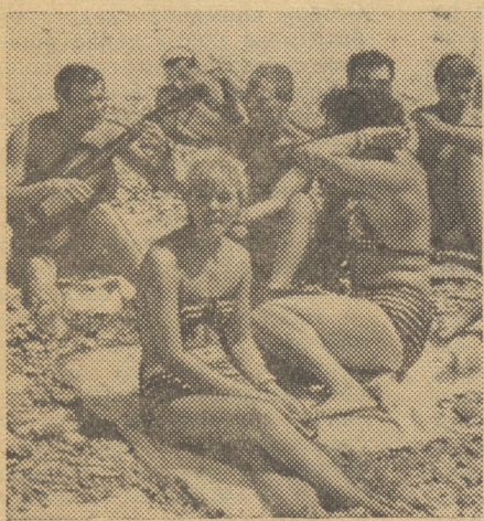
На снимке: группа наших студентов на пляже в Геленджике.

Дотации, оплачиваемые отпуска, организация питания, материальная помощь, бесплатные лекции, концерты в МУКе и многое другое — все это обеспечивает право наших студентов, рабочих и сотрудников института на хороший отдых.