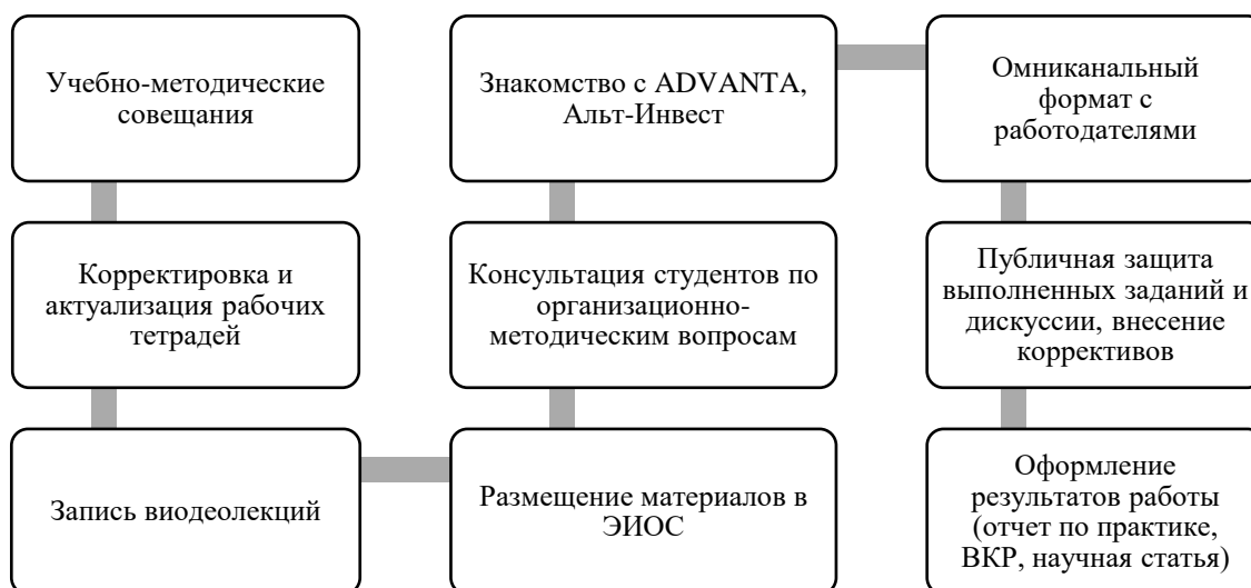
Рисунок 2 – Алгоритм работы с магистрантами в интересах предприятий-работодателей (составлено авторами)

Указанные перспективы для молодых специалистов требуют включения и/или развития в учебных планах дисциплин, связанных с формированием навыков организации научно-исследовательской работы и работы в проектных командах. В соответствии с обозначенным мейнстримом, можно предложить образовательным организациям алгоритм работы с обучающимися по программам магистратуры, опирающийся на проблемно-ориентированный подход (рисунок 2).