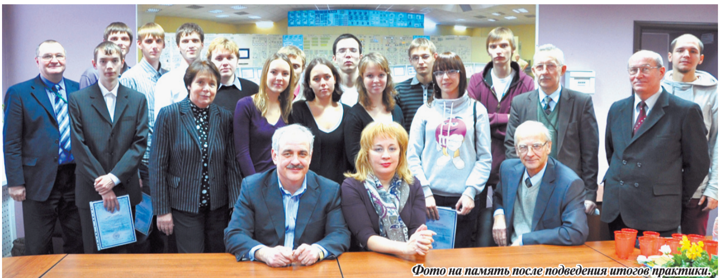
Фото на память после подведения итогов практики.