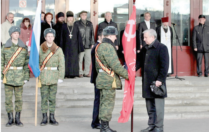
6 декабря в нашем университете прошли торжества, посвященные 70-летию битвы под Москвой: митинг, концерт, чествование ветеранов.