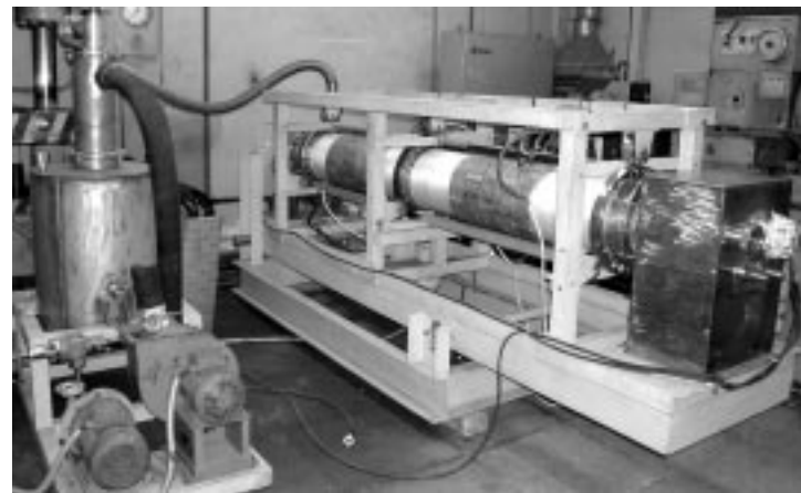
Одна из современных установок кафедры — опытно-промышленный кальцинатор жидких радиоактивных отходов роторного типа с индукционным нагревом рабочей камеры, созданная по заказу ГУП МосНПО «Радон» в 2006 году.

Только благодаря тому, что на кафедре хорошо работает аспирантура, нам