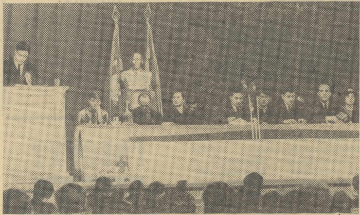
(Окончание. Начало см. на 1-й стр.)

отметить, что в этом году почти вдвое сократился отсев студентов.